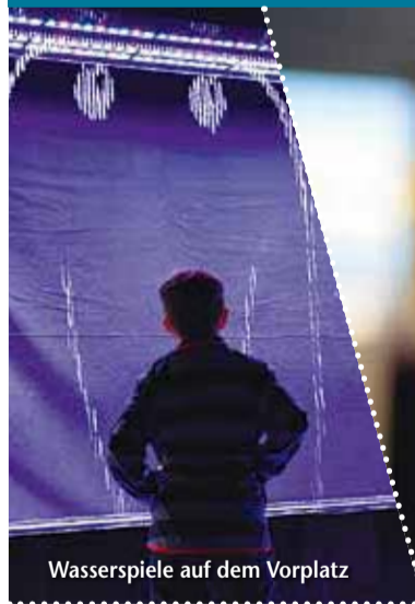
Wasserspiele auf dem Vorplatz