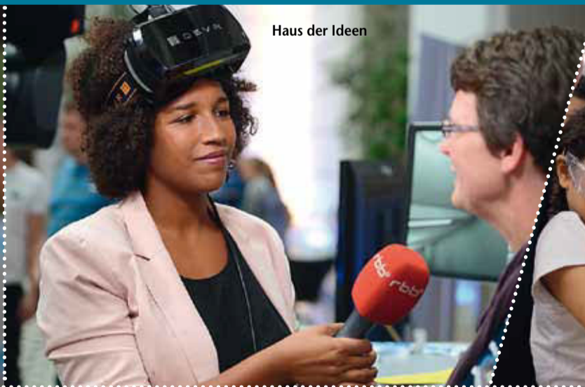
Haus der Ideen