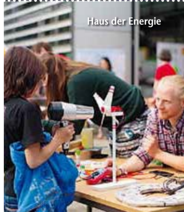
Haus der Energie