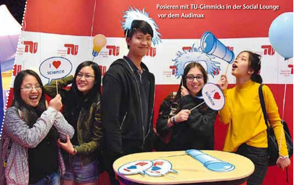
Posieren mit TU-Gimmicks in der Social Lounge vor dem Audimax