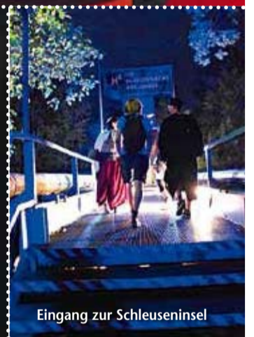
Eingang zur Schleuseninsel

BEIM ERSTEN INSTAWALK DER TU BERLIN warfen die Instagrammer einen Blick vom Geodätenstand auf dem Hauptgebäude und von der Uni-Bibliothek auf die City West, ins Foyer und ins Magazin der UB und beobachteten, wie der Funkballon für die Forschung in den Himmel stieg