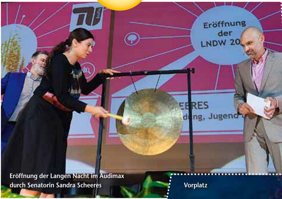
Eröffnung der LNDW 2016 im Audimax durch Senatorin Sandra Scheeres