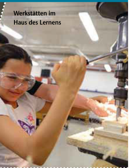
Werkstätten im Haus des Lernens