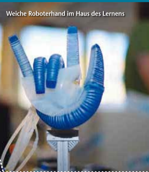
Weiche Roboterhand im Haus des Lernens