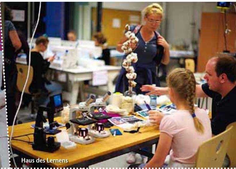
Haus des Lernens