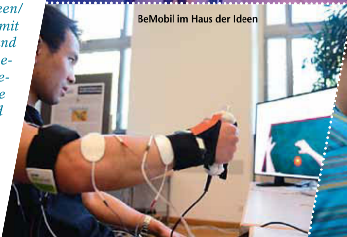
BeMobil im Haus der Ideen