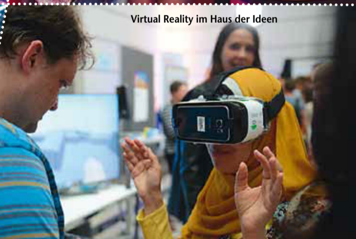
Virtual Reality im Haus der Ideen