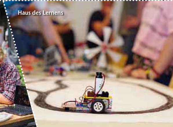
Haus des Lernens