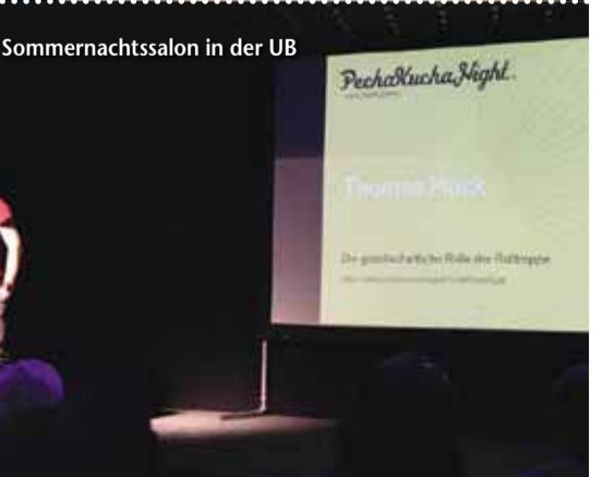
Sommernachtssalon in der UB