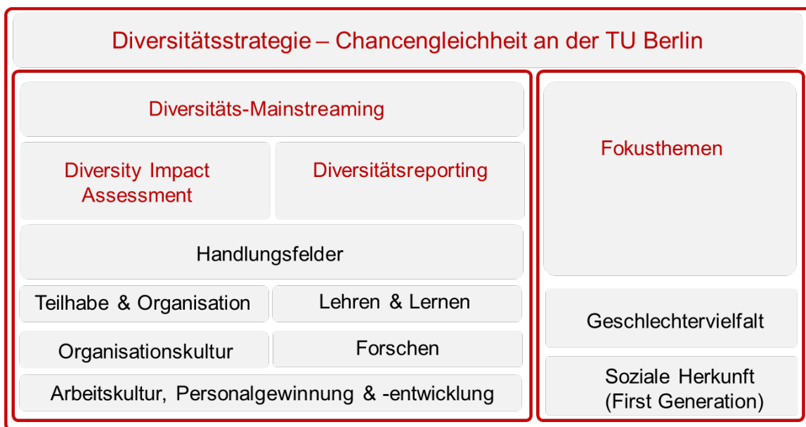
Abbildung 2: Umsetzung der Diversitätsstrategie an der TU Berlin.

Abbildung 2 stellt dar, wie im Sinne des Diversitäts-Mainstreamings Diversitätsaspekte systematisch und flächendeckend in den zentralen Handlungsfeldern der universitären Entwicklung integriert werden sollen. Komplementär dazu behandeln die Fokusthemen spezifische Fragestellungen für einen bestimmten Zeitraum schwerpunktmäßig. Diese Aktivitäten werden begleitet durch ein Diversitätsreporting, welches darauf zielt, Erkenntnisse über die Diversität der TU Berlin und ihrer Mitglieder zu gewinnen, bestehende Maßnahmen summativ zu evaluieren und die Effekte der durchgeführten Maßnahmen sichtbar zu machen.