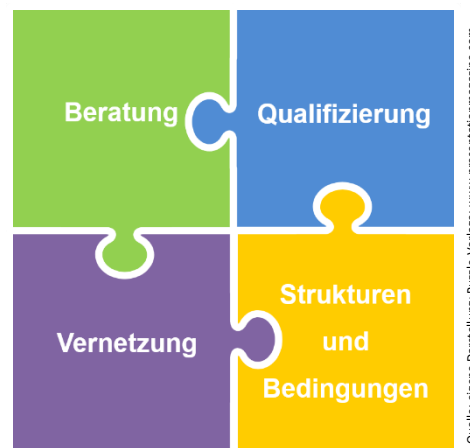
Abb. 2: Die vier Handlungsfelder der Personalentwicklung an der TU Berlin